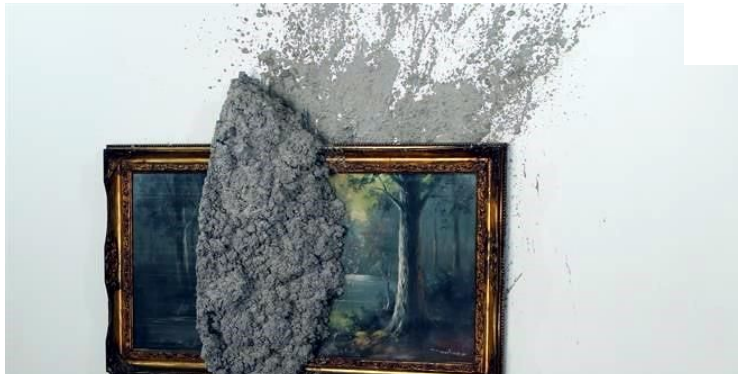
"Horror Vacui", (escena nocturna No. 1), de Alejandro Almanza Pereda

Angélica Orozco Guadalajara, México (27 agosto 2014).-